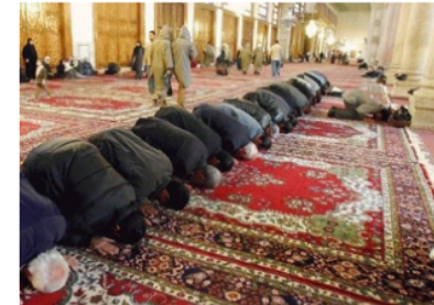
Be vänd mot Mecka