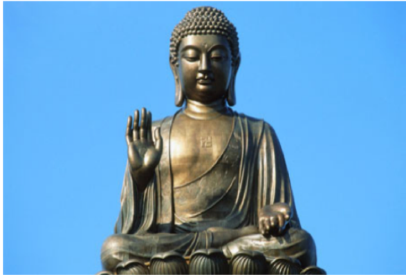
Staty av Buddha