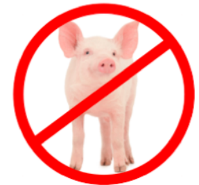
Äter inte gris